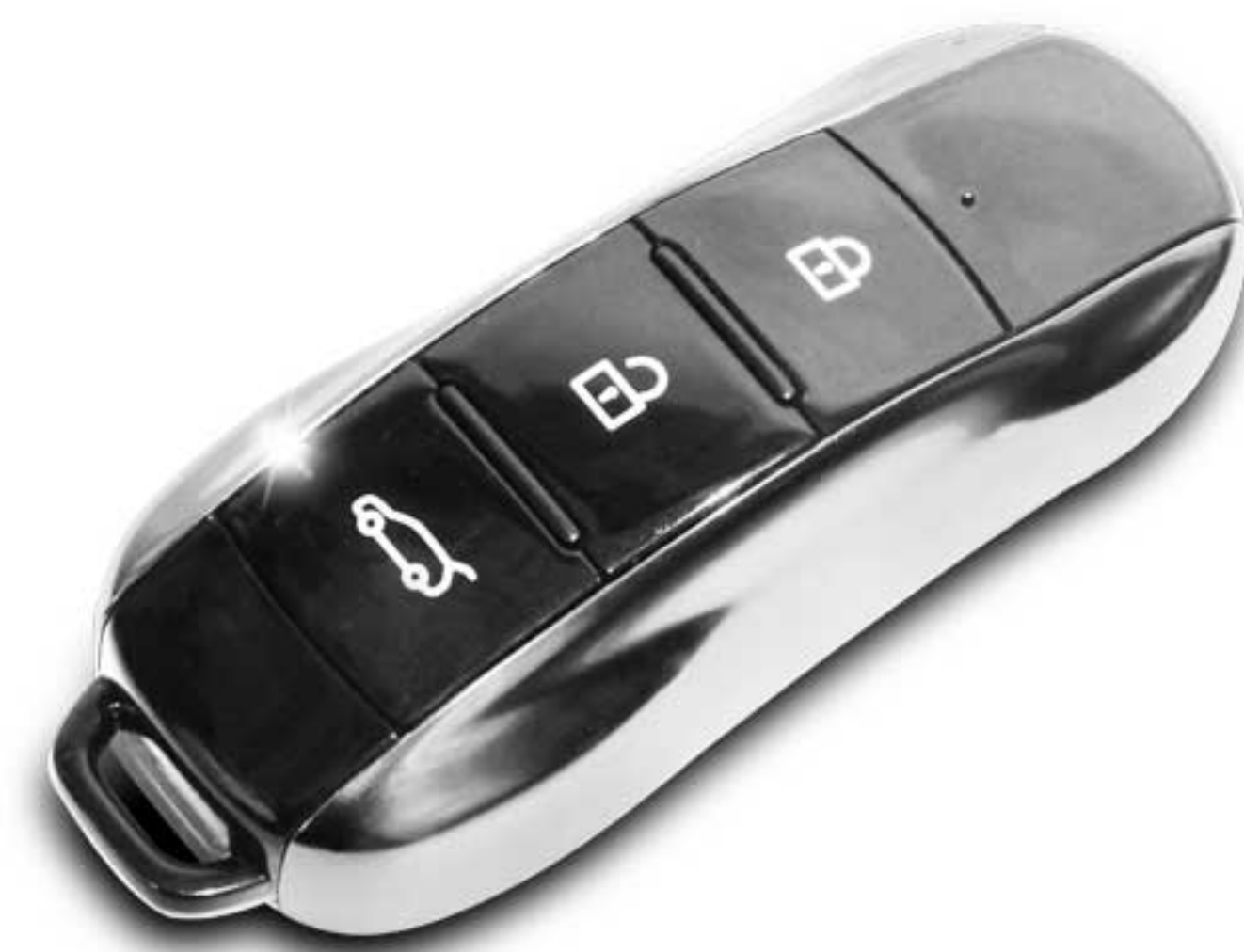
سیستم هوشمند ورود بدون کلید (Keyless System)