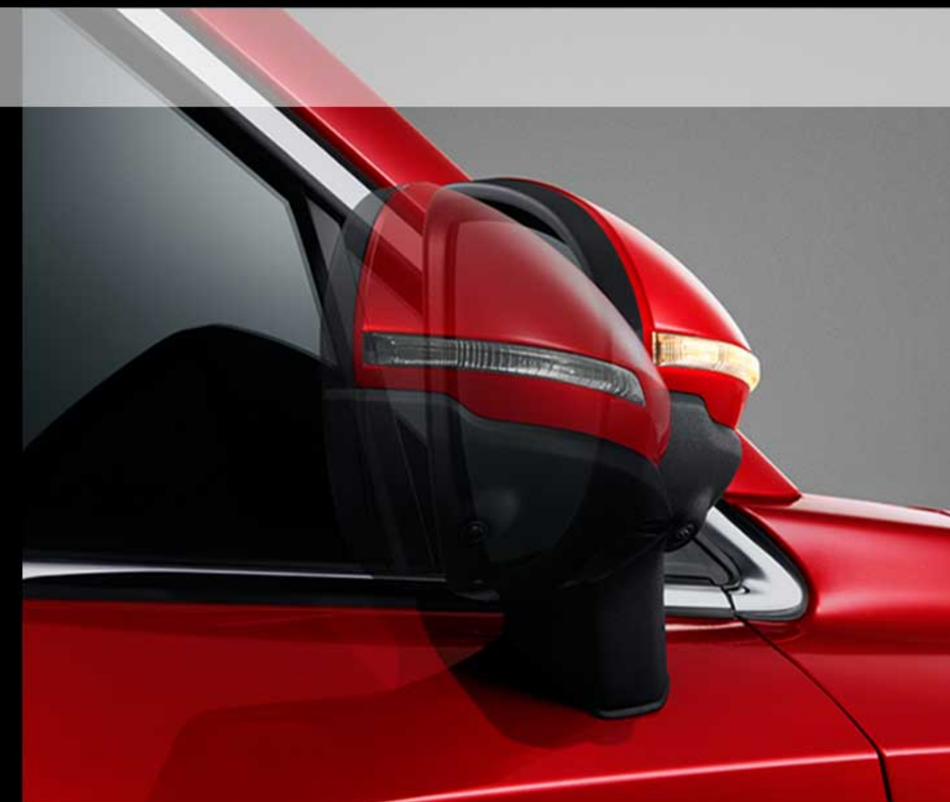
آینه های جانبی برقی تاشو به همراه گرم کن و چراغ خوش آمدگویی