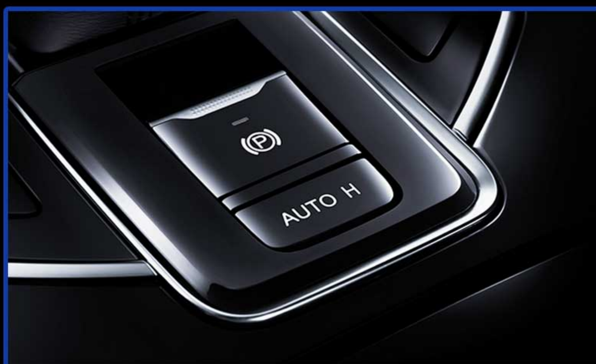
ترمز پارک برقی EPB سیستم توقف خودکار به همراه Auto Hold