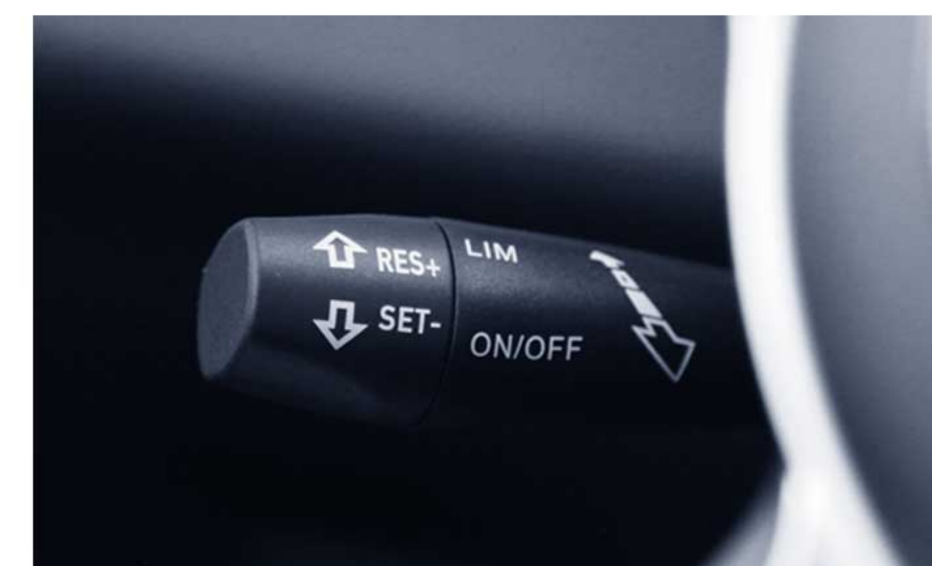
تثبیت کننده سرعت خودرو (کروز کنترل)