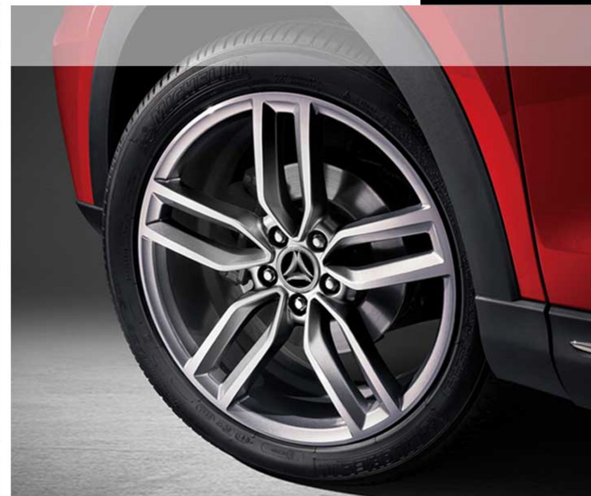
رینگ آلومینیومی ۱۸ اینچی