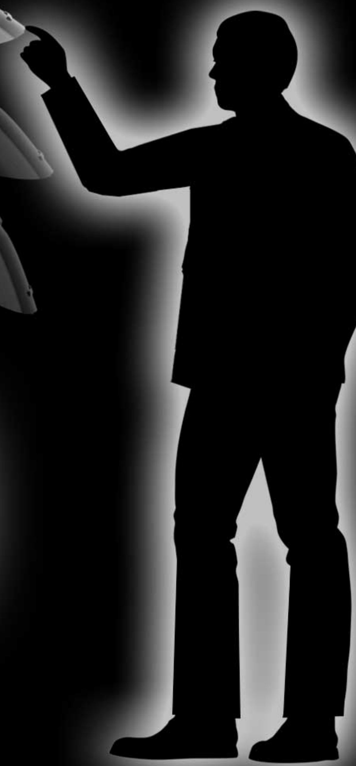
درب برقی صندوق عقب و کلید مخصوص جهت بسته شدن درب