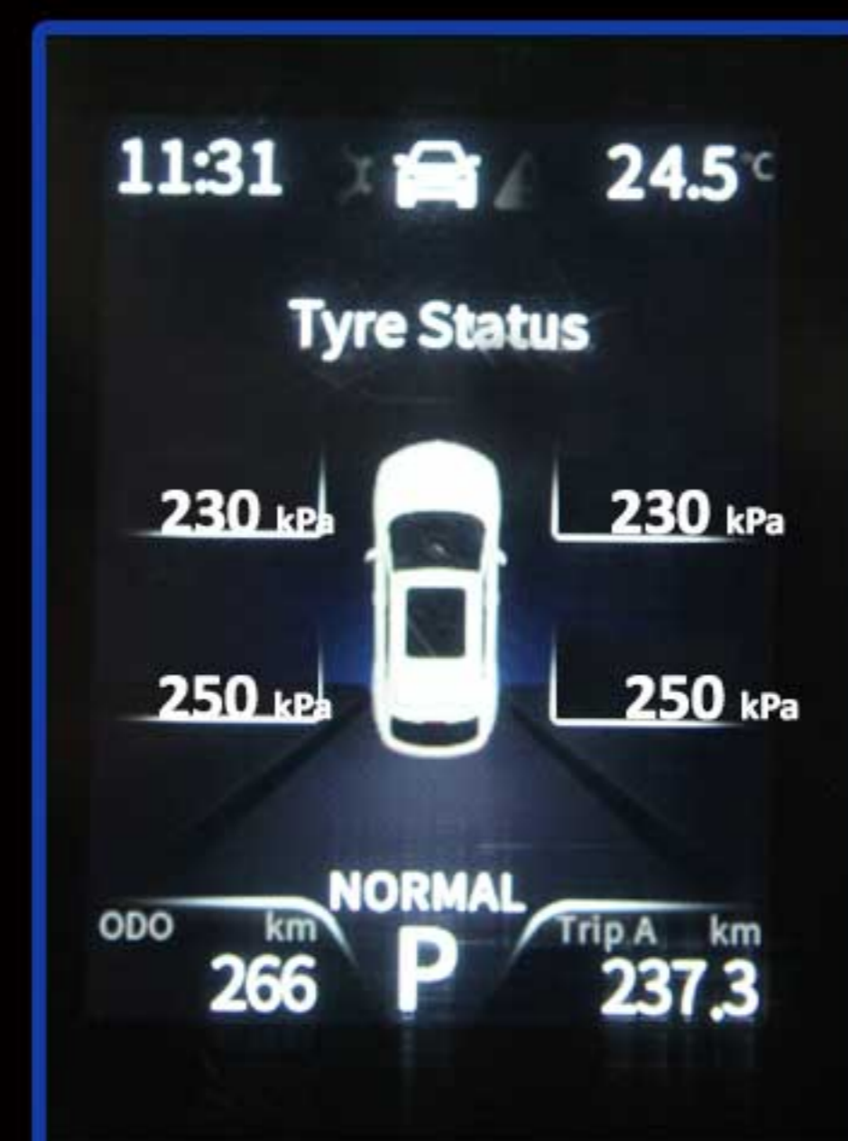
سیستم نمایش لحظه ای فشار باد تایرها TPMS