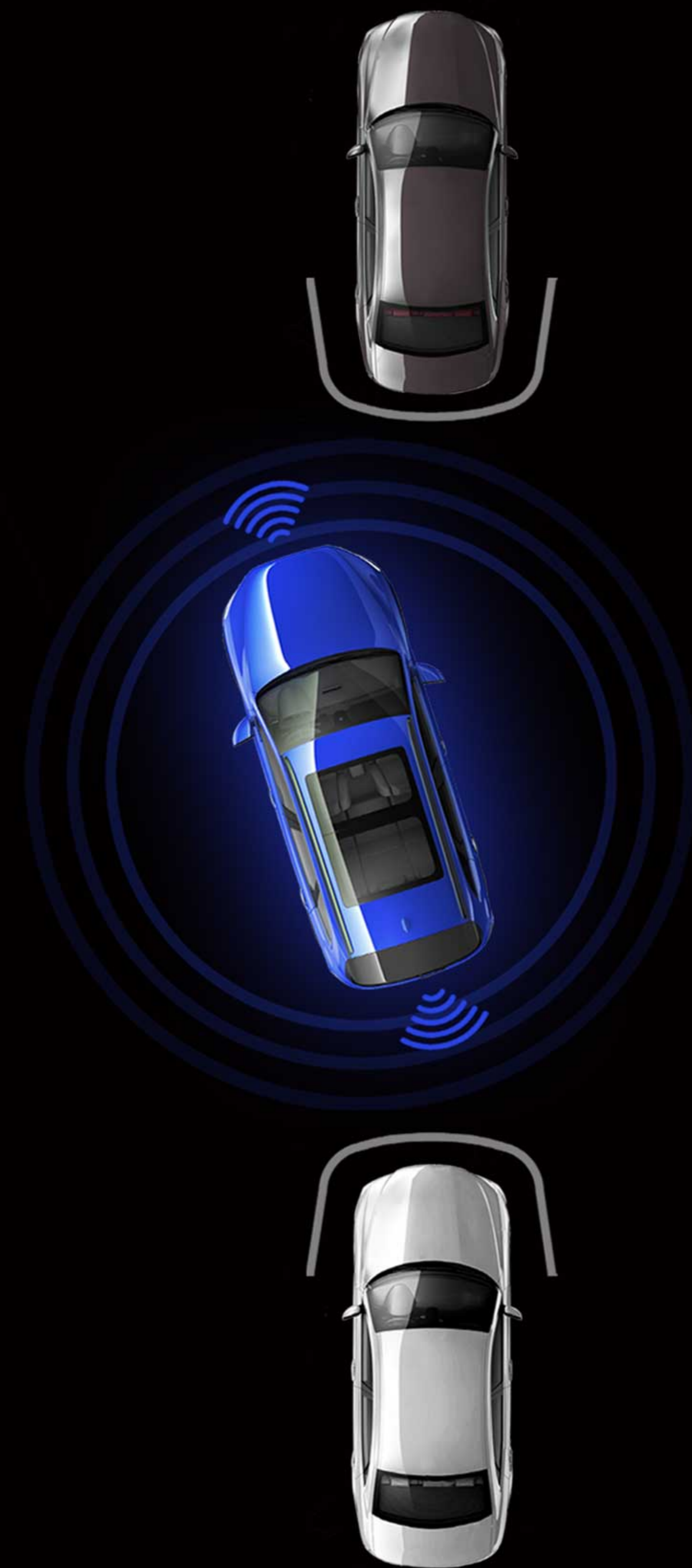
سیستم تشخیص مانع سنسور پارک عقب و جلو