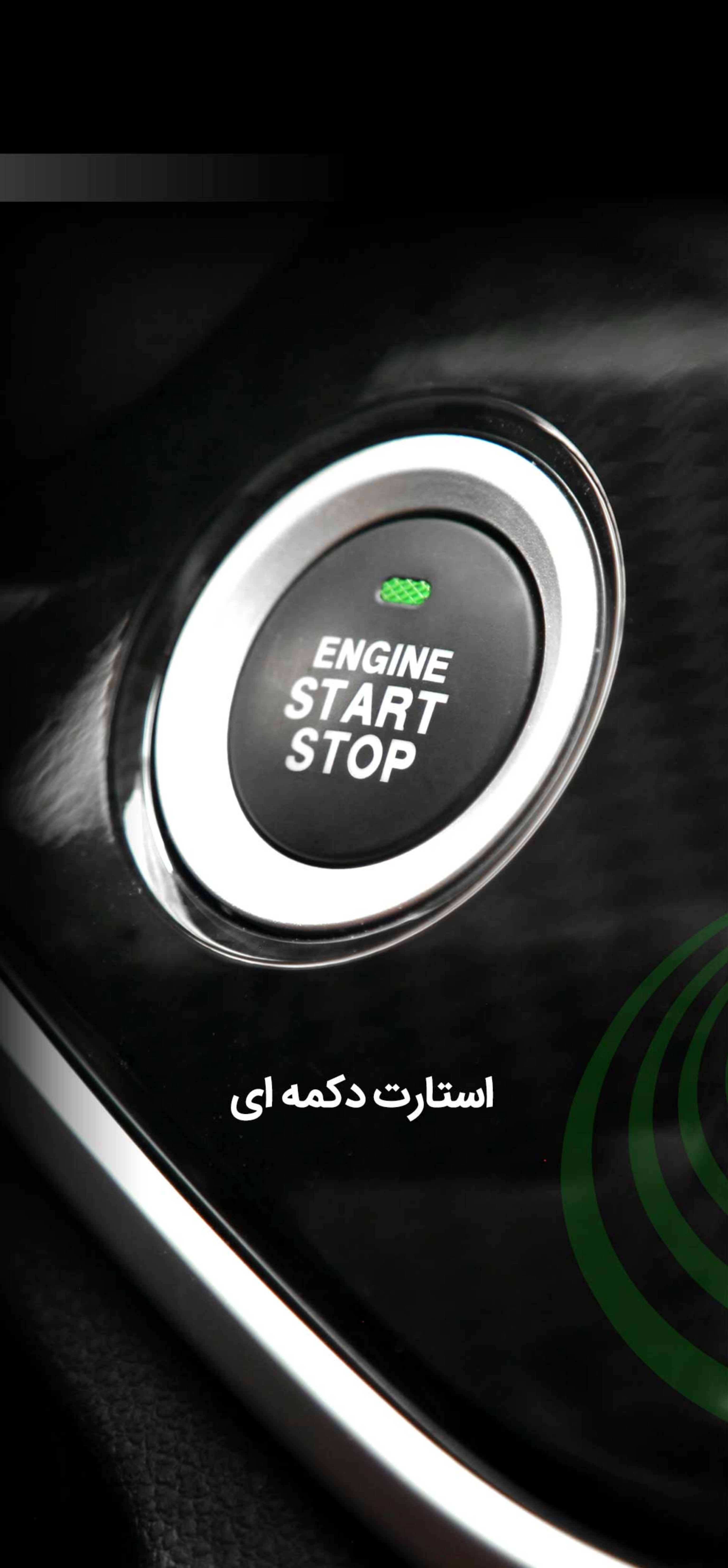
استارت دکمه ای