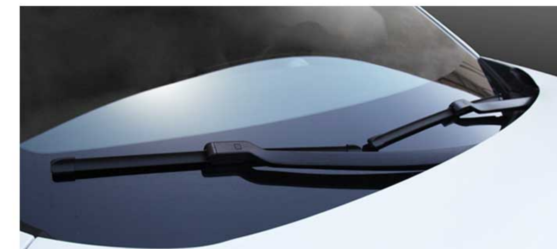
برف پاک کن اتوماتیک جلو به همراه سنسور باران