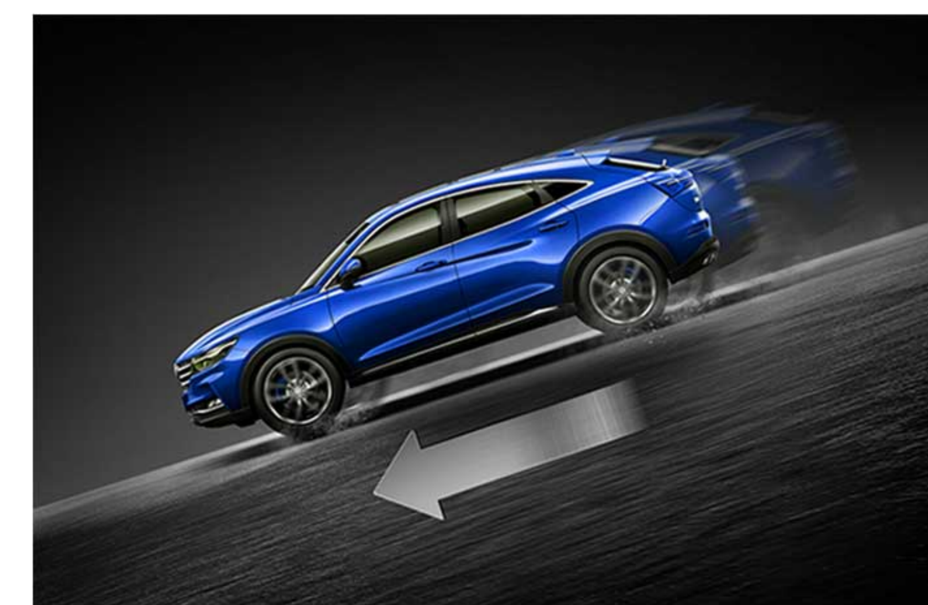
سیستم کنترل حرکت خودرو در سرازیری (HDC)