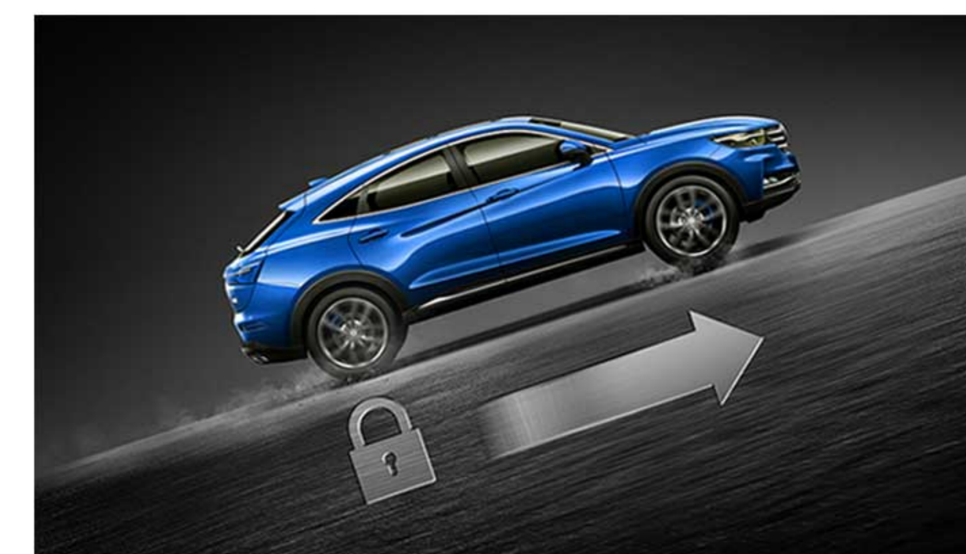
سیستم کنترل شروع به حرکت در سربالایی (HAC)