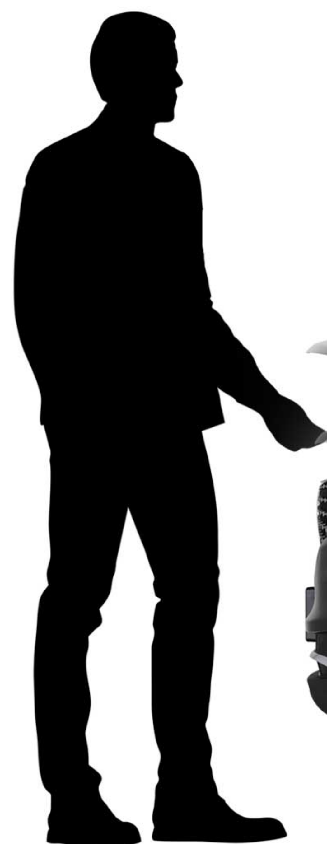
جک های گازی برای باز کردن درب موتور با یک اشاره