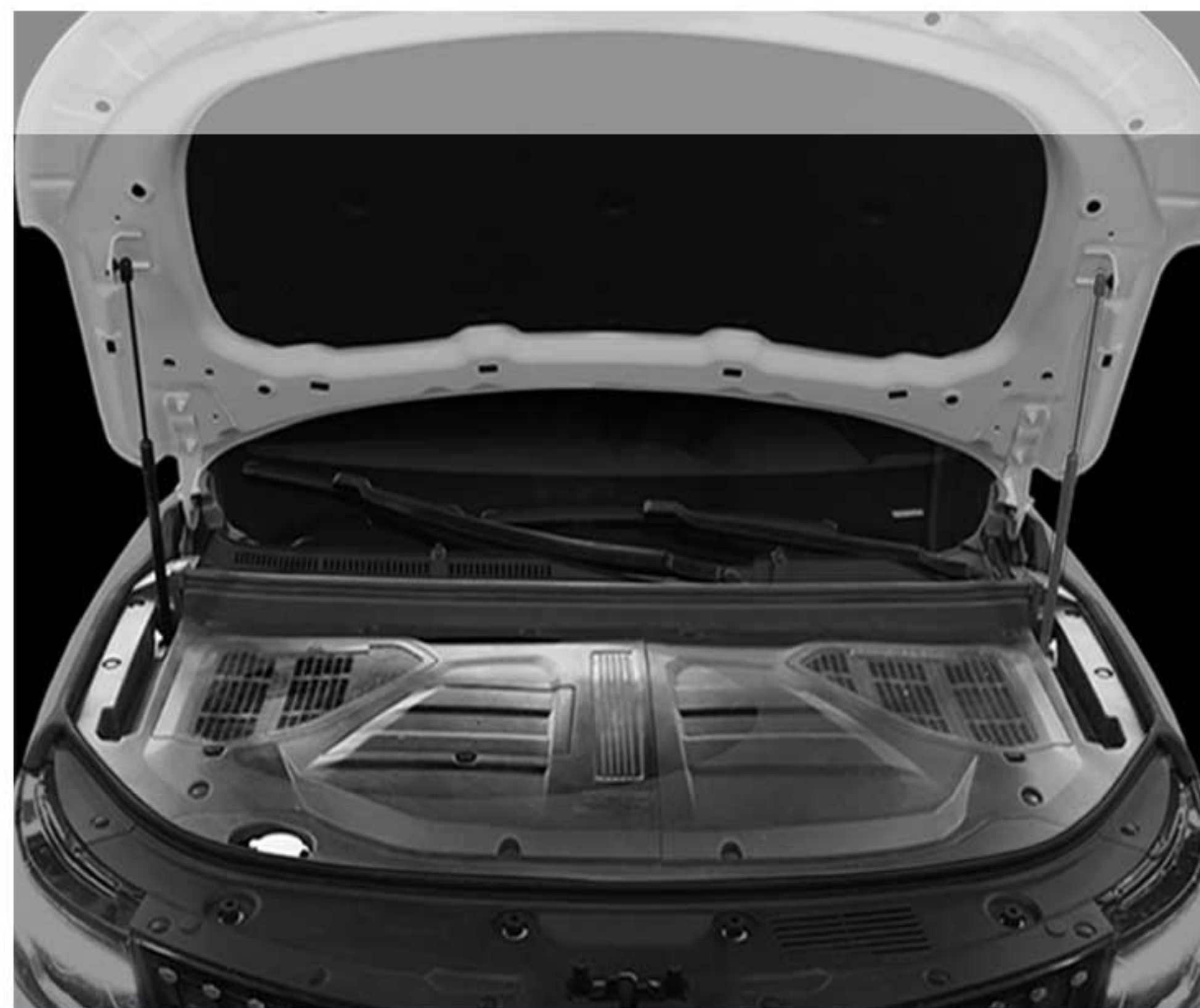
پوشش یکپارچه محفظه موتور